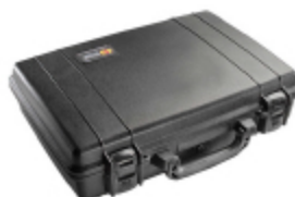
1470NF No Foam