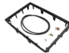
1470PF Châssis pour application spéciale