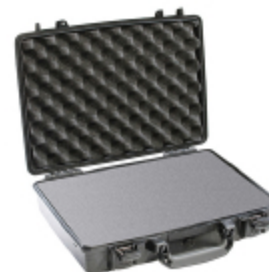
1470WF With Foam