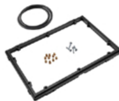
1150PF Châssis pour application spéciale