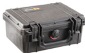
1150NF No Foam