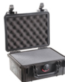
1150WF With Foam