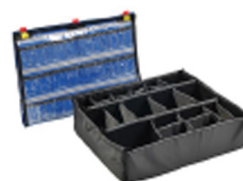
1605EMS Trousse d'accessoires EMS (classeur pour couvercle et jeu de séparateurs)