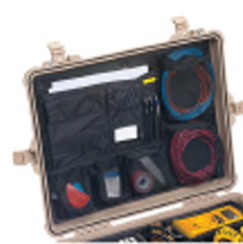
1609 Pochette couvercle