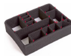
1600EUTP Trousse de séparateurs pour coffre TrekPak