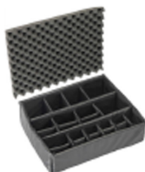
1605 Cloison en mousse