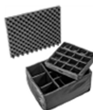
1625 Cloison en mousse