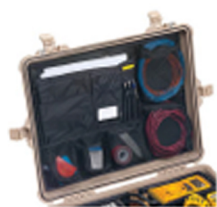
1609 Pochette couvercle