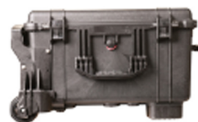
1620MNF No Foam