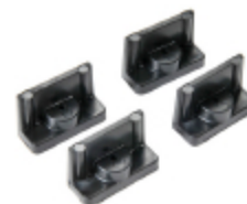
1507 Fixations rapides - Jeu de 4