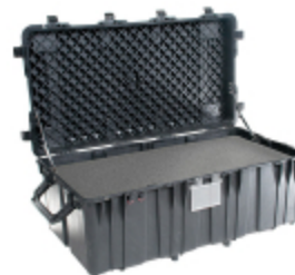
0550WF With Foam