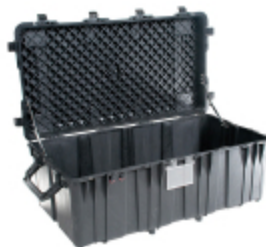
0550NF No Foam