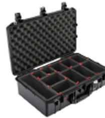
1555TP With TrekPak Divider System