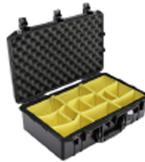
1555WD With Padded Dividers