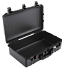
1555NF No Foam