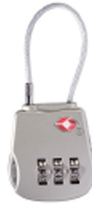
1506TSA Cadenas TSA