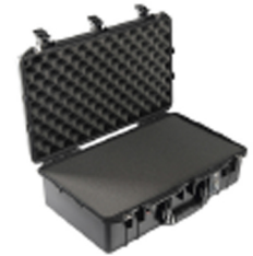
1555WF With Foam