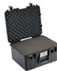
1557WF With Foam