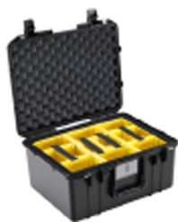
1557WD With Padded Dividers