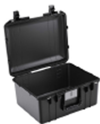
1557NF No Foam