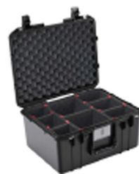
1557TP With TrekPak Divider System