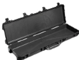
1750NF No Foam