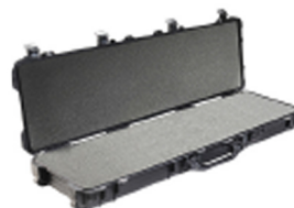
1750WF With Foam