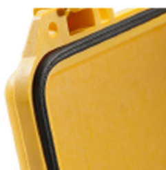
1773 Joint torique de remplacement