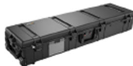
1770NF No Foam