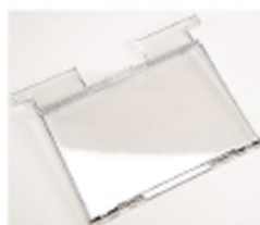
1630DC Accessoire conteneur de documents