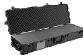
1770WF With Foam