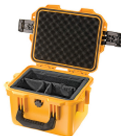
iM2075-X0002 With Padded Dividers