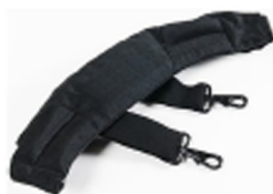
iM-STRAP-S-VER2 Bandoulière rembourrée