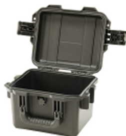
iM2075-X0000 No Foam