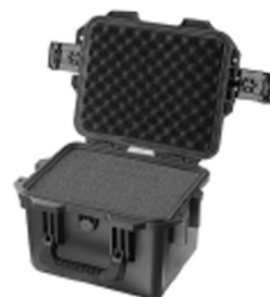
iM2075-X0001 With Foam