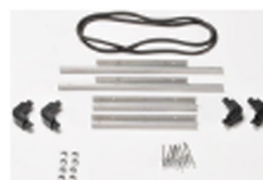
iM2200-M4-BEZEL-L Cadre de couvercle (métrique)