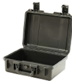
iM2200-X0000 No Foam