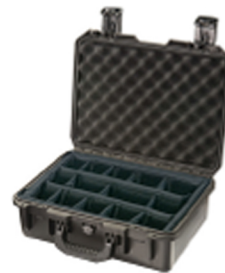
iM2200-X0002 With Padded Dividers