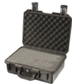
iM2200-X0001 With Foam