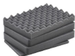
iM2200-FOAM Jeu de mousses de rechange, 4 pièces