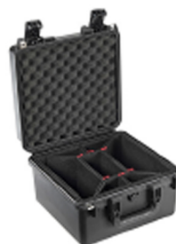
iM2275-X0006 With TrekPak Divider System