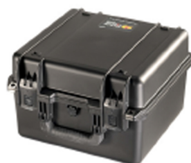
iM2275-X0000 No Foam