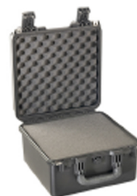
iM2275-X0001 With Foam