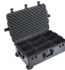
iM2950-X0006 With TrekPak Divider System