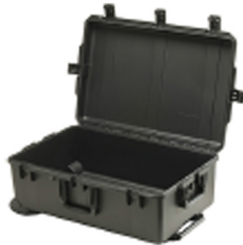
iM2950-X0000 No Foam