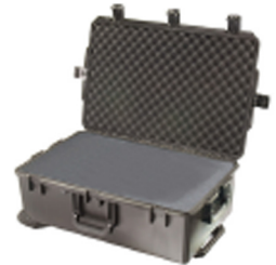
iM2950-X0001 With Foam