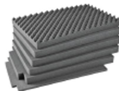
IM2950-FOAM Jeu de mousses de rechange, 6 pièces