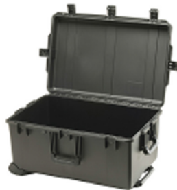
iM2975-X0000 No Foam