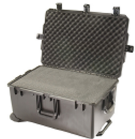
iM2975-X0001 With Foam