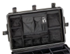
IM29XX-UTILITYORG Pochette utilitaire