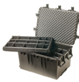
iM3075-X0002 With Padded Dividers