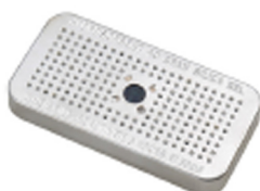
1500D Gel de silice déshydratant Peli