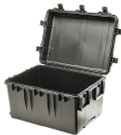
iM3075-X0000 No Foam