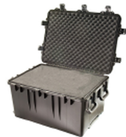
iM3075-X0001 With Foam