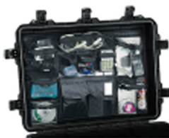
iM3075-UTILITYORG Pochette utilitaire