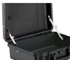
iM-LIDSTAY Compas de couvercle