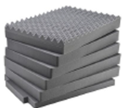
iM3075-FOAM Jeu de mousses de rechange, 7 pièces