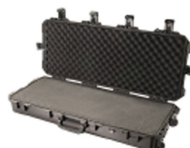
iM3100-X0001 With Foam