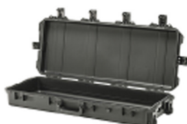
iM3100-X0000 No Foam