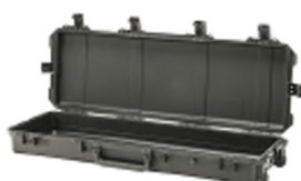
iM3200-X0000 No Foam