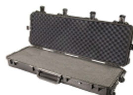
iM3200-X0001 With Foam