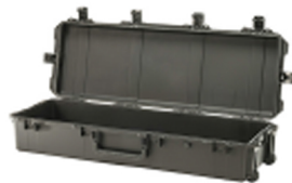
iM3220-X0000 No Foam