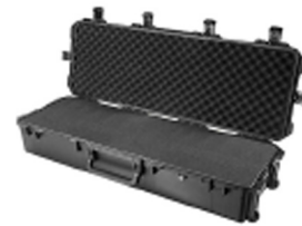
iM3220-X0001 With Foam