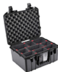
1507TP With TrekPak Divider System