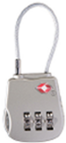
1506TSA Cadenas TSA