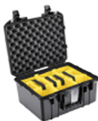
1507WD With Padded Dividers