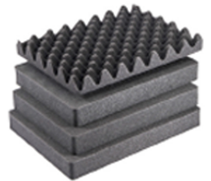
1507AirFS Jeu de mousses de rechange, 5 pièces