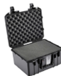
1507WF With Foam